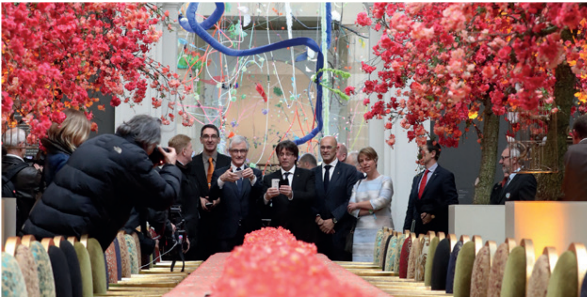
Minister-president van Catalonië, Carles Puigdemont, bezoekt samen met Minister-president Geert Bourgeois de Gentse Floraliën op 30 april 2016.

De Unie mag in geen geval uitgroeien tot een culturele eenheidsworst. We moeten wel verder inzetten op het creëren van verbondenheid binnen de EU, dit moet van onderen uit worden aangemoedigd via stedenbanden en jumelages, culturele samenwerking en uitwisselingsprogramma's.