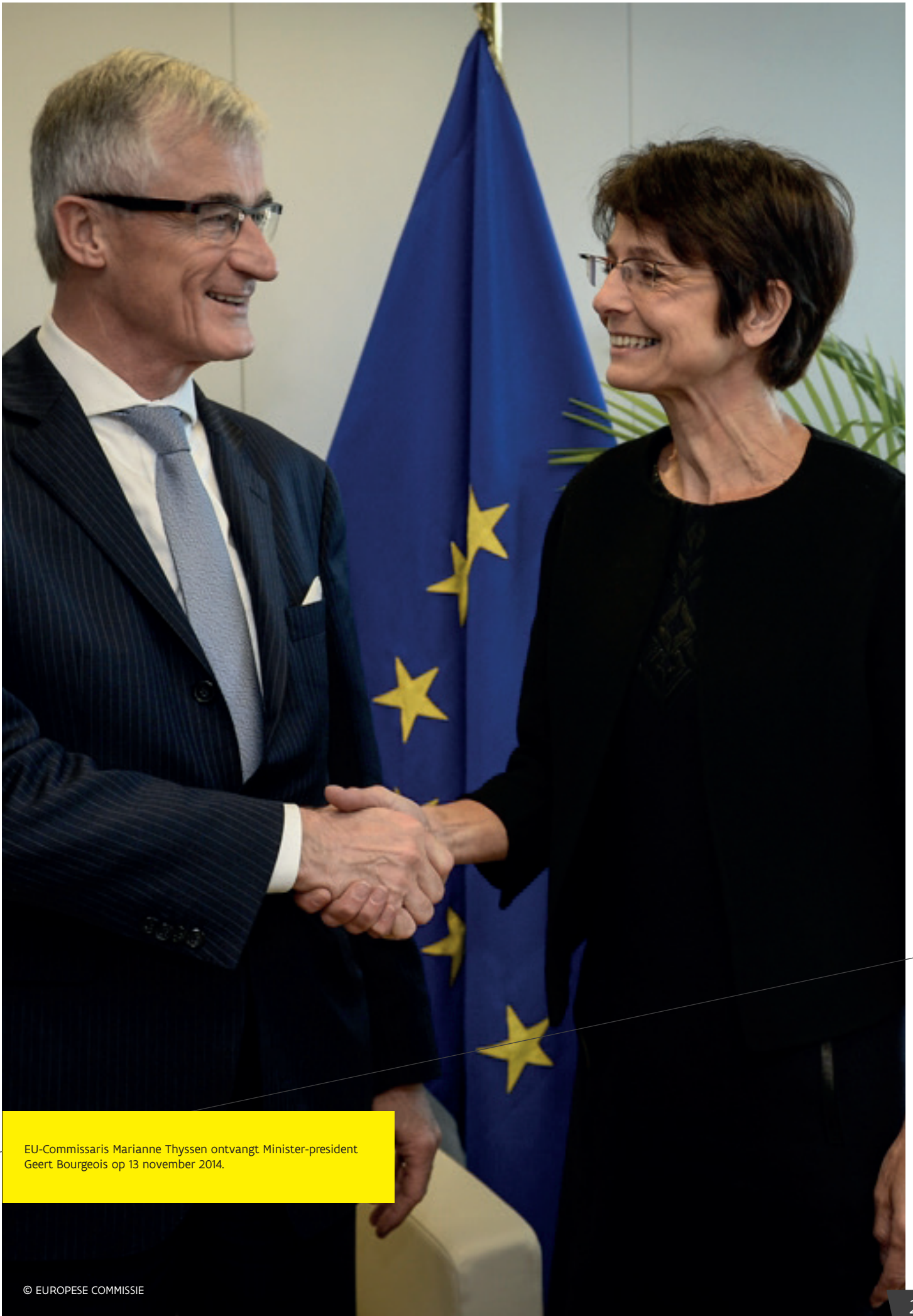
EU-Commissaris Marianne Thyssen ontvangt Minister-president Geert Bourgeois op 13 november 2014.