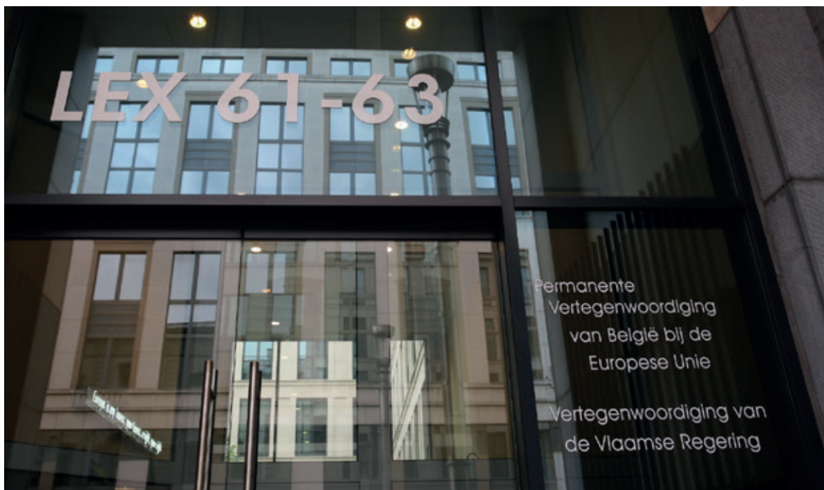
De Algemene Afvaardiging van de Vlaamse Regering bij de Permanente Vertegenwoordiging van België bij de Europese Unie.

Meer (gedeelde) EU-bevoegdheden hebben ook betrekking op onze deelstaatbevoegdheden (cohesiebeleid, gemeenschappelijk landbouw en visserijbeleid, energie, klimaat, transport, economie, innovatie, onderzoek, media, handel en investeringsbeleid enz.) dan op federale bevoegdheden. In België gaat bovendien het grootste aandeel van het EU-budget naar de deelstaten. Het is dus zaak dat Vlaanderen de rechtstreekse band met de EU versterkt en de gehele Vlaamse overheid zich een proactieve EU-reflex aanmeet.