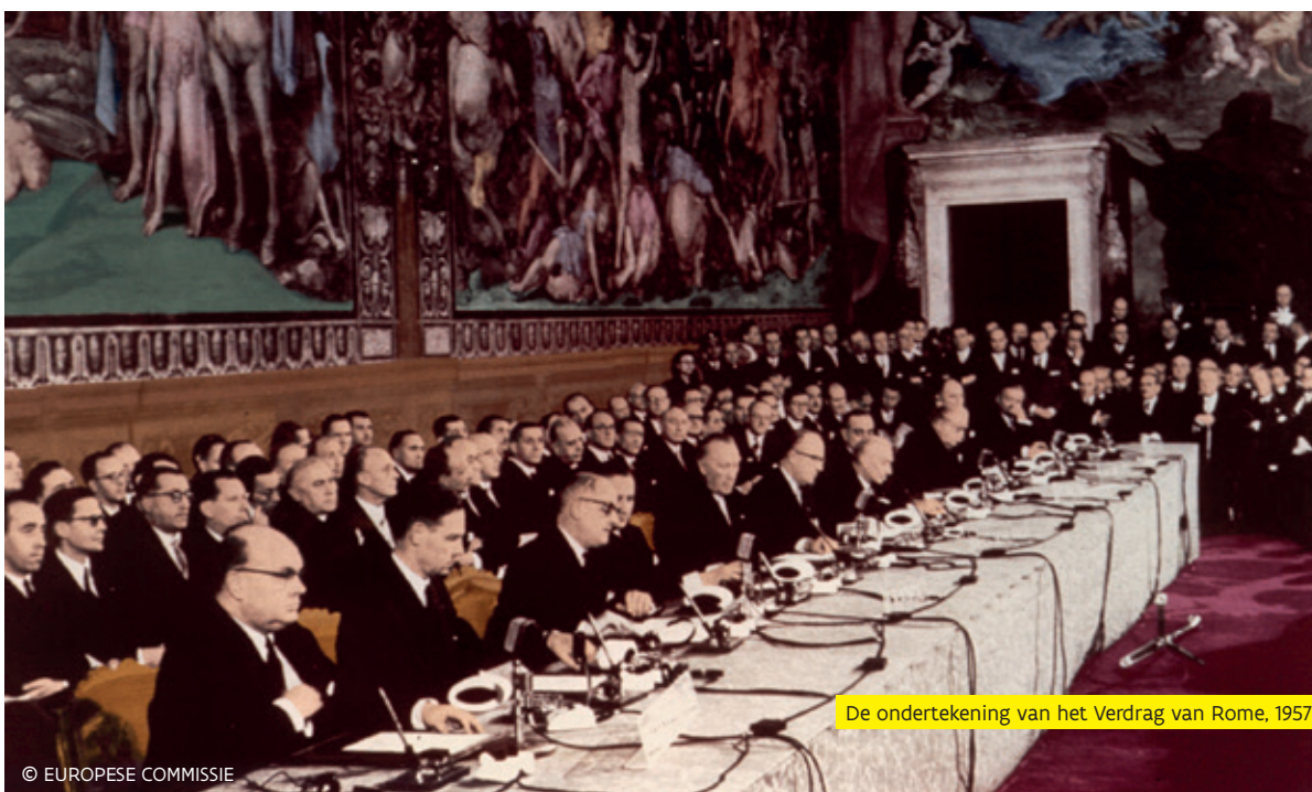
De ondertekening van het Verdrag van Rome, 1957.

Met het cohesiebeleid wenst de EU de convergentie tussen concurrentievermogen en sociale vooruitgang in de lidstaten te stimuleren.