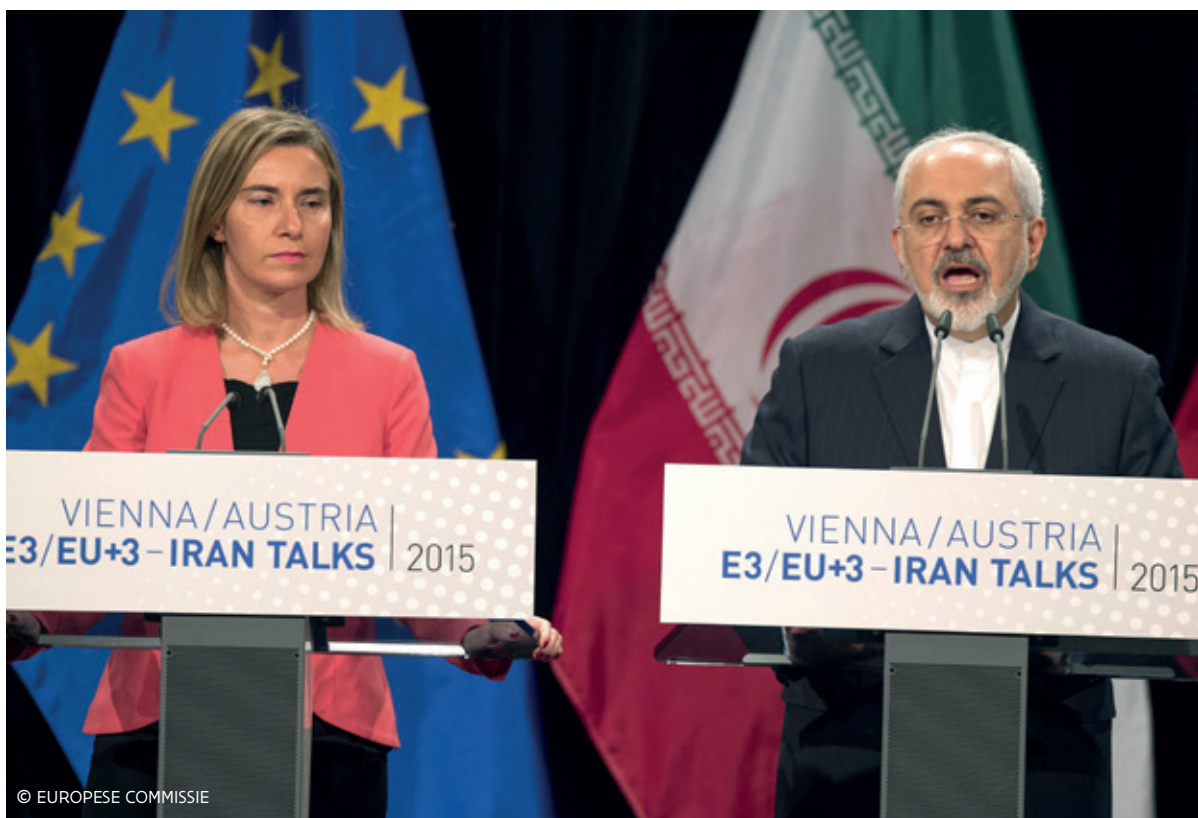
Federica Mogherini, Hoge Vertegenwoordiger van de Europese Unie voor Buitenlandse Zaken en Veiligheidsbeleid, en Mohammed Javad Zarif, Minister van Buitenlandse Zaken van Iran. 14 juli 2015 – Wenen

De EU moet haar diplomatiek korps ook blijvend inzetten om verdere stappen te zetten in de wereldwijde aanpak van de klimaatverandering. Na het klimaatakkoord in Parijs moeten er blijvende inspanningen gebeuren om afspraken te vertalen in concrete verbintenissen en in tastbare maatregelen. De EU beschikt over heel veel ervaring en expertise om dit proces als geloofwaardige partner mee aan te sturen en vorm te geven.